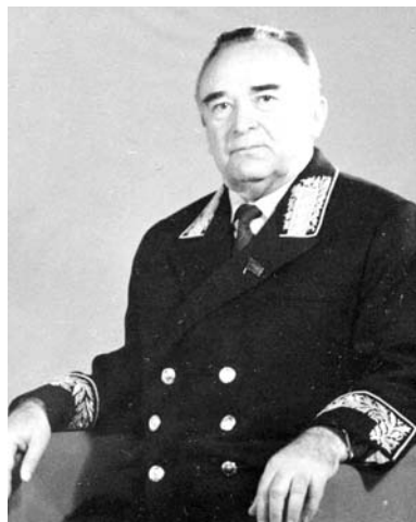
Первый секретарь Северо-Осетинского обкома КПСС в 1961-1982 гг.

Нужно сразу отметить, что принципиальным моментом для осетинских руководителей был маршрут трассы: он должен был проходить через Рукский перевал. Этому всячески противодей-